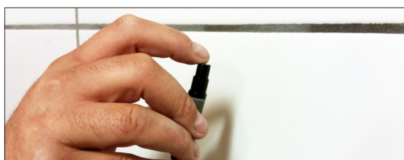
3. Spraya på ytan för infästning. Avlägsnar damm och fett.