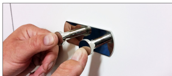
8. Montera beslaget på vägg. Se till att det ligger dikt an väggytan.