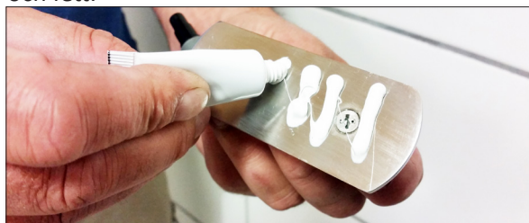
5. Applicera lim på beslaget.