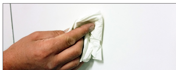
4. Torka ytan ren och torr.