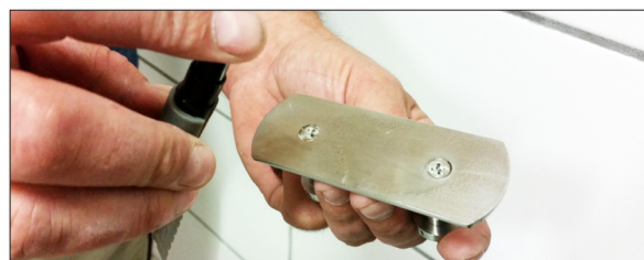
2. Spraya på ytan med medföljande spray. Torka torrt.