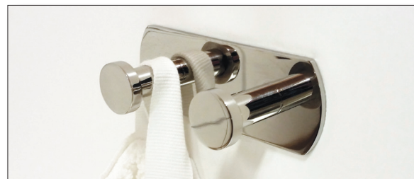
10. Färdig installation! Utan onödiga håltagningar, samt är också möjlig att demontera. Se vidare anvisningar på www.design4bath.se