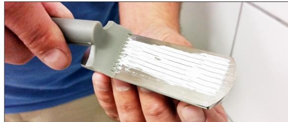
6. Fördela limmet över ytan med tandspackeln.