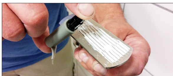
7. Spraya på limmet. Accellerar härdningsprocessen.